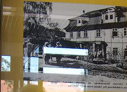
Průtok Lanouka sloužila ke spokojenosti obyvatel i jako atrakci při procházkách na