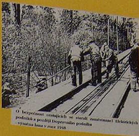
O bezpečnosti cestujících se staral zaměstnanec Elektrických podniků a poradil i dopravě podniku - Výměna lana v roce 1948